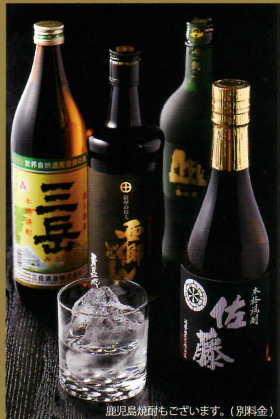
鹿児島焼酎もございます。(別料金)

「明治維新 150周年」を迎える鹿児島から、 黒豚、黒牛、黒さつま鶏などの「黒」食材を集めて。